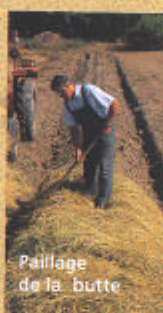
Paillage de la butte

2 - La plantation sur butte (petit talus) à la charrue est intéressante. Elle augmente l'épaisseur de la couche fertile à la disposition des plants, et pour les terrains à tendance humide, elle évite l'engorgement hivernal.