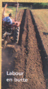
Labour en butte

1 - Dès l'été, couvrir la bande de 1,5 à 2 m devant recevoir la haie, par un épais paillage, ici un rouleau de 200 kg pour 20 m de long sur 2 de large. Au jardin, on privilégie les tontes de gazon, les fanes, les feuilles.