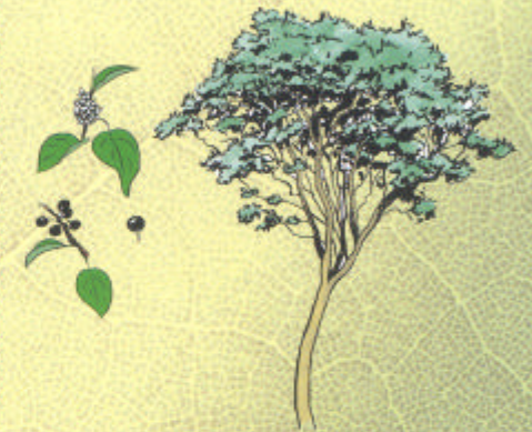
NERPRUN PURGATIF Rhamnus cathartica

Adapté montagne et plaine. Sols secs, humides, calcaires. Baies en automne-hiver.