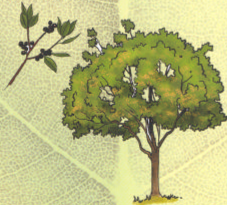
NERPRUN ALATERNE Rhamnus alaternus

Adapté plaine. Sols secs, calcaires. Baies en automne-hiver.