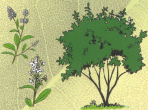
TROENE Ligustrum vulgare