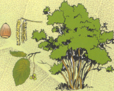
NOISETIER Corylus avellana

Adapté montagne et plaine. Sols humides, calcaires. Graines en automne-hiver.