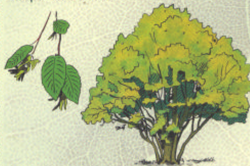
CHARME COMMUN Carpinus betulus

Adapté plaine. Sols secs, humides, calcaires.