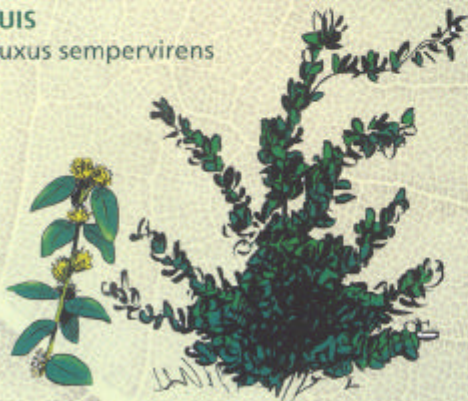
BUIS Buxus sempervirens

Adapté montagne et plaine. Sols secs, calcaires.