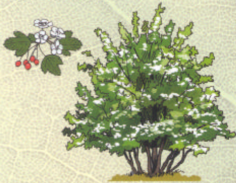
AUBEPINE BLANCHE Crataegus oxyacantha

Adapté montagne et plaine. Tous sols. Baies en automne-hiver.